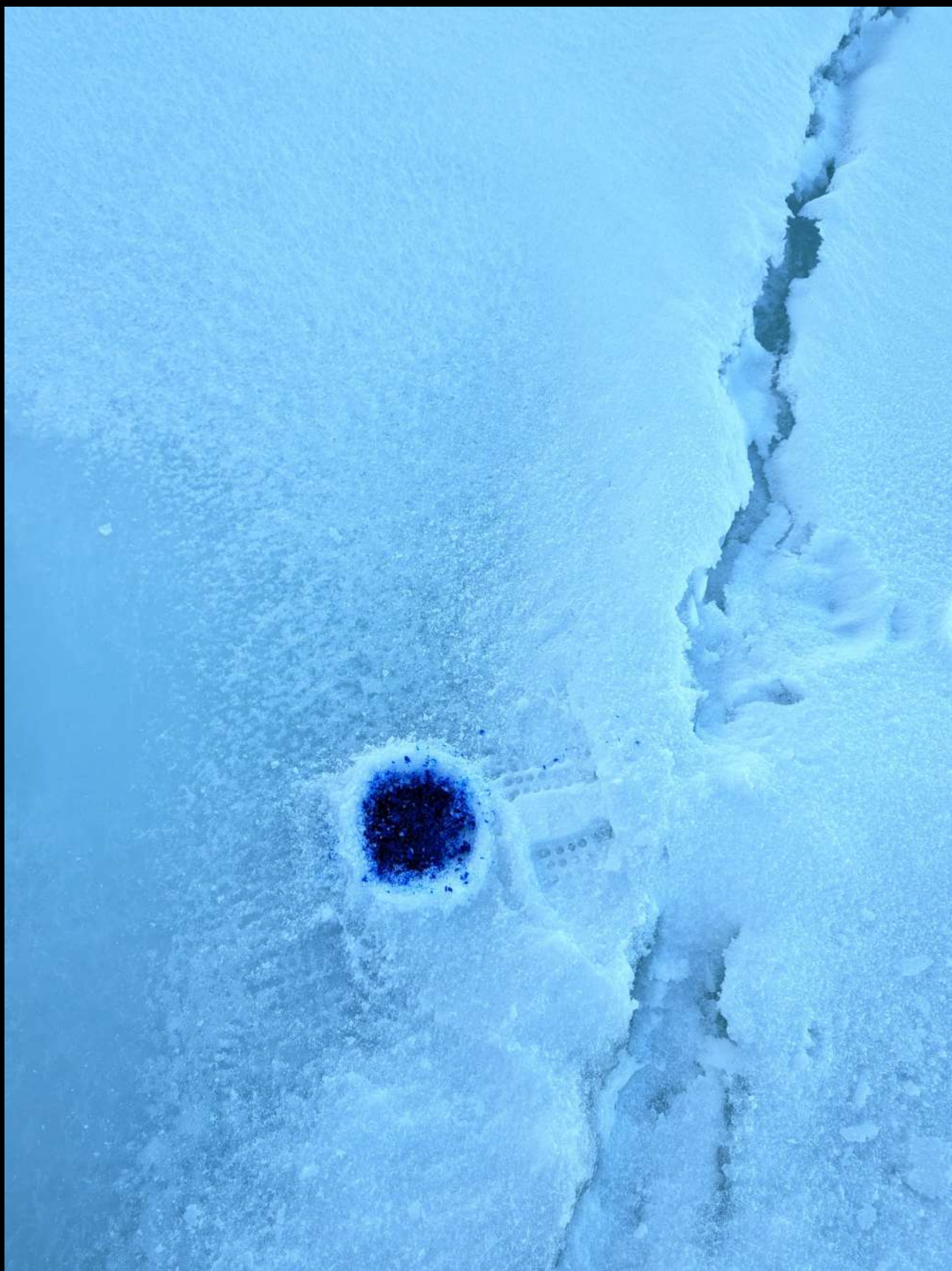
ISSINEQ 7/7 – Groenland, 11 avril 2023 Indigo pur sur banquise, glace de mer arctique