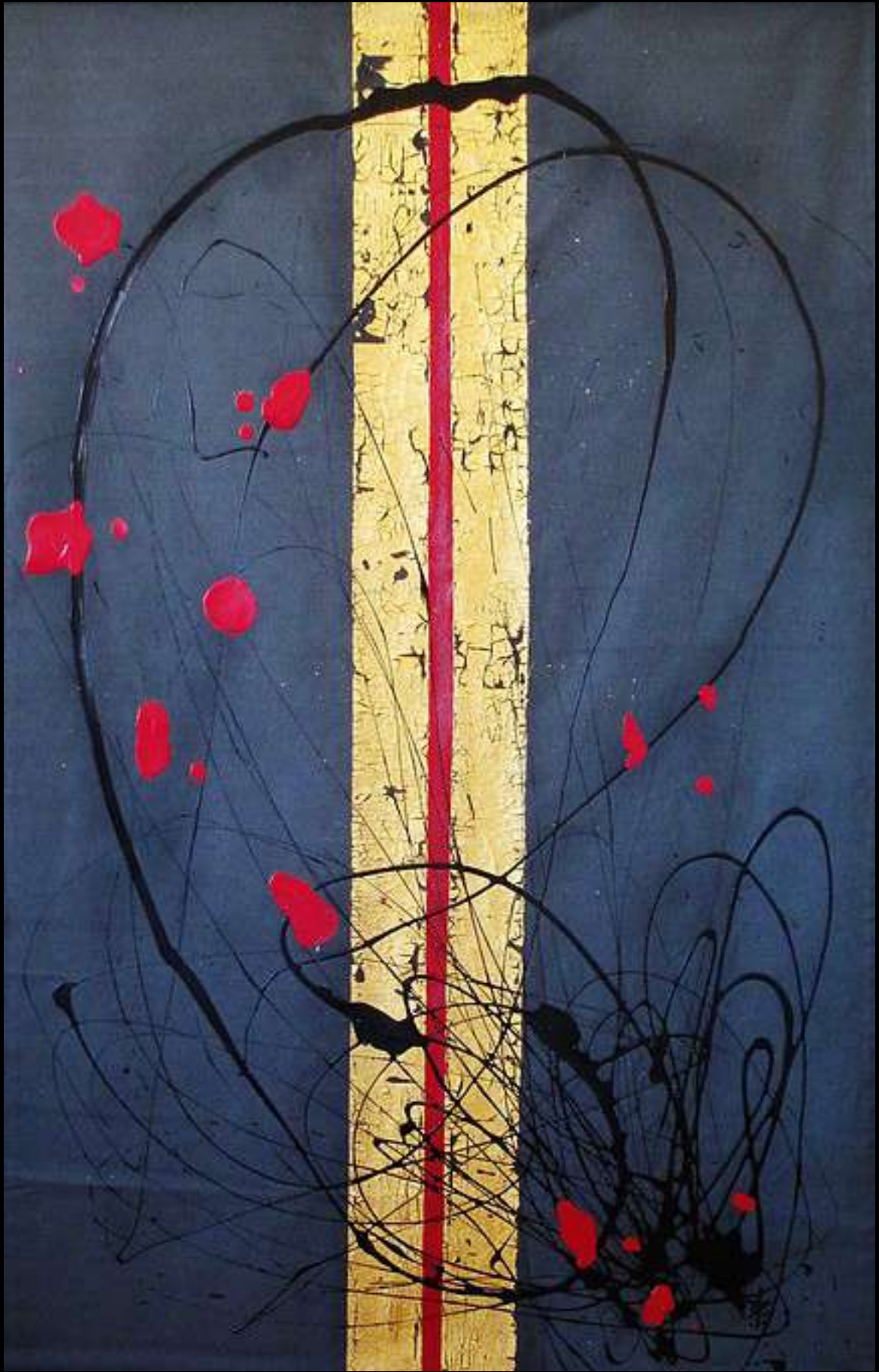
Introspection Collection « ANTARCTICA-GAMMA » Station scientifique Dumont d'Urville Terre Adélie, Antarctique, 2017

Or pur 24 carats et acrylique sur toile 100 x 160cm