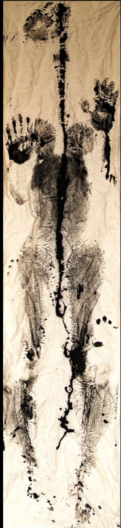
ZAZEN SEPIA 4/7 – 5 nov 2022 Encre de seiche sur toile de lin 52 x 206 cm