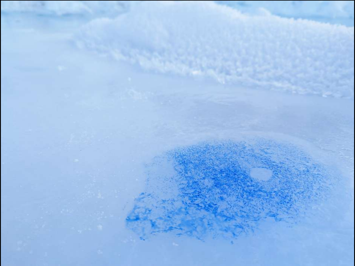
ISSINEQ 1/7 – Groenland, 4 avril 2023 détail Indigo pur sur banquise, glace de mer arctique