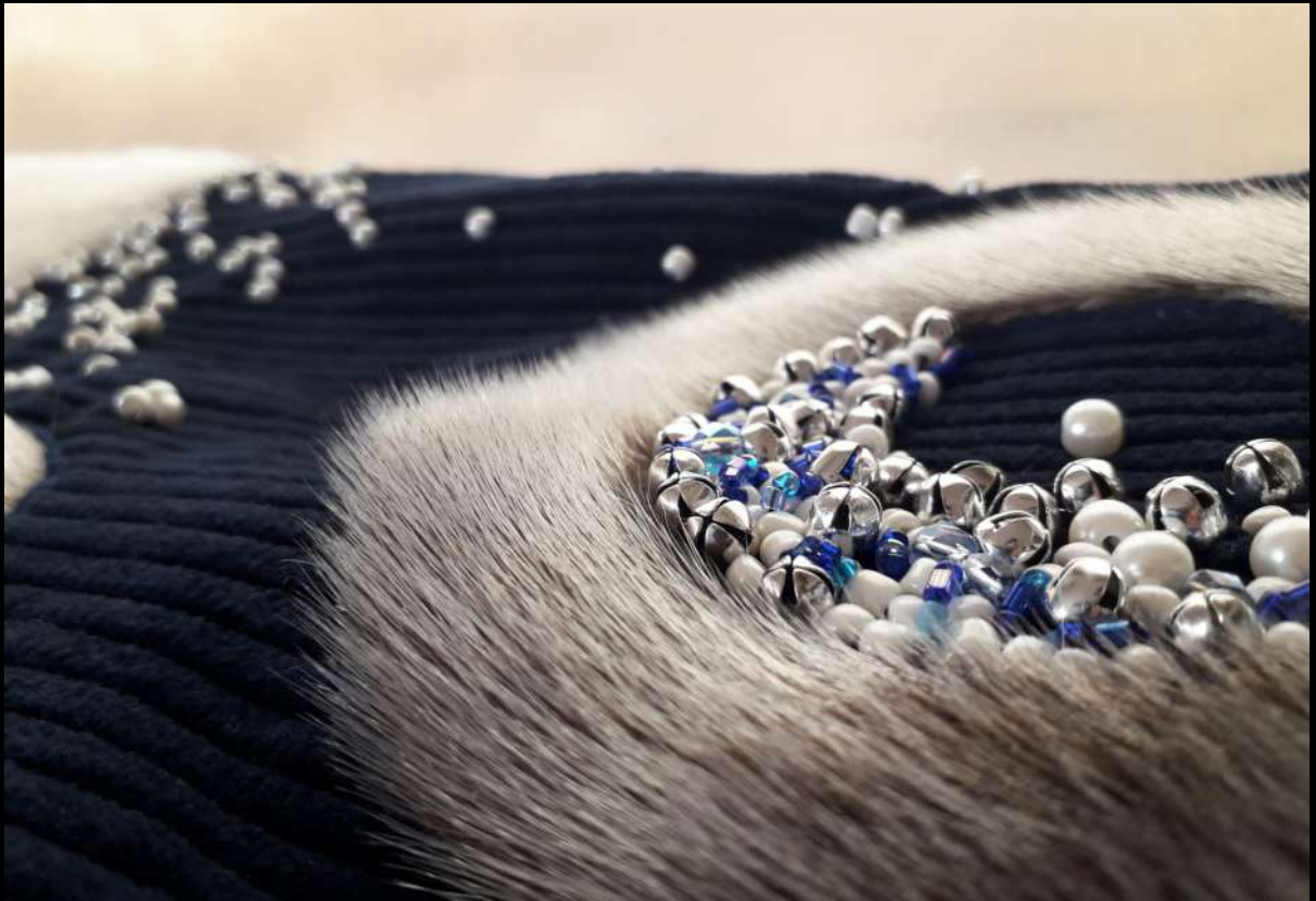
PUISI KINTSUGI costume chamane 6/7 – Groenland, 2020