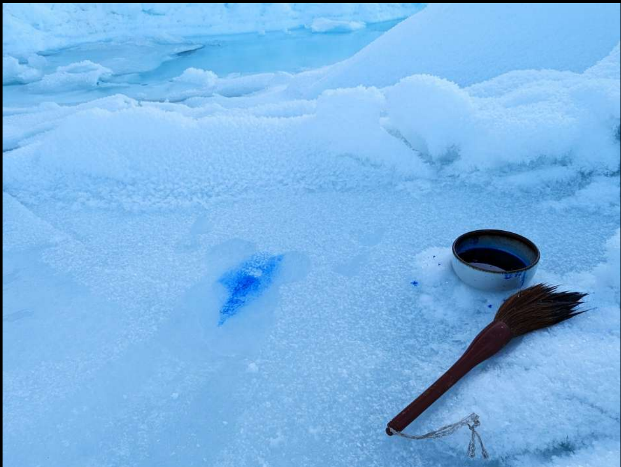
ISSINEQ 2/7 – Groenland, 6 avril 2023 Indigo pur sur banquise, glace de mer arctique